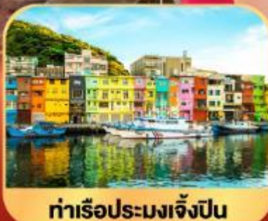
ท่าเรือประมงเจิ้งปิ่น