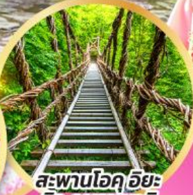
สะพานโอคุอียะ นิจู คาซุระบาชิ