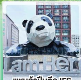
แพนด้าป็นตึก IFS