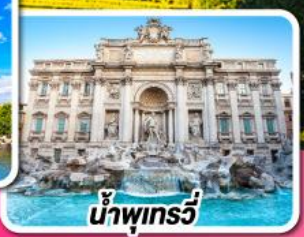
น้ำพุทรวี่