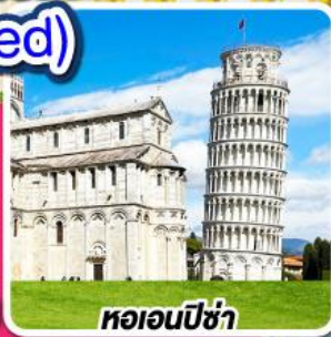
หอนอนปิซ่า