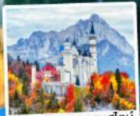
ปราสาทน้อยชวานส์ไตน์