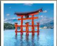
ศาลเจ้าอิตสึคุชิมะ