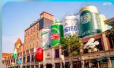
ถนนเบียร์ชิงเต่า