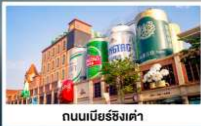
ถนนเบียร์ชิงเต่า