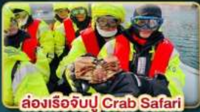
ล่องเรือจับปู Crab Safari

📅 เดินทาง: 08-16 ต.ค. | 07-15 พ.ย. 30 พ.ย. - 08 ธ.ค. 69