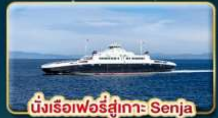
นั่งเรือเฟอร์รี่สู่เกาะ Senja