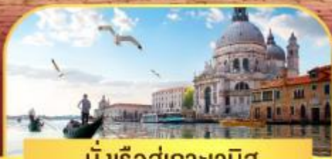
นั่งเรือสุทเกาะเวนิส