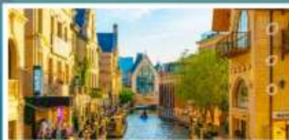
เมืองน้ำเวนิสตะวันออก