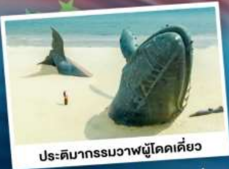
ประติมากรรมวาฬโคดเคียว

เที่ยวเมืองชายทะเลโอปิตีตี ซิงเต่า - ต้าเหลียน - ฉะเจียงไถ่