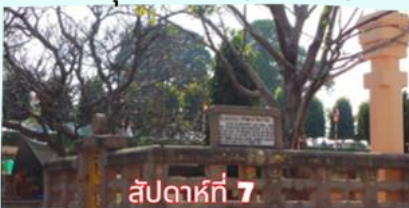
ราชายณะ (จำลอง)