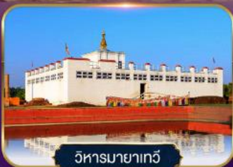
วิหารมายาแก้ว