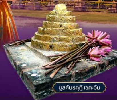
มูลคันธกุฎี เขตเววัน