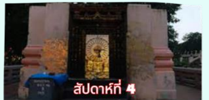
รัตนขรรเจดีย์ (ซุ้มเรือนแก้ว)

เรียบร้อยแล้ว นำคณะจาริกบุญสวดมนต์ทำวัตรเย็น บูชาพระรัตนตรัย และสวดมนต์บูชาสังเวชนียสถาน จากนั้นเชิญท่านทำศนาธรรม นั่งสมาธิปฏิบัติบูชาตามอัยาศัย สมควรแก่เวลา นัดหมายเวลาเชิญท่านกลับโรงแรมที่พัก