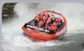
สนุกกับเรือ Shotover Jet