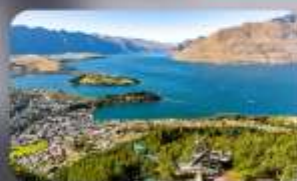
นั่ง Skyline สู่ Bob's Peak