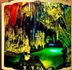
ถ้ำน้ำเป็นซี