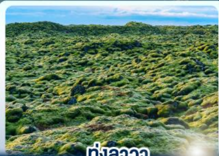
♨️ ทุ่งลาวา