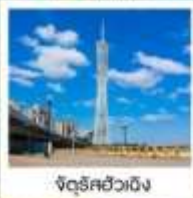
จัตุรัสอ่าวเจิ้ง