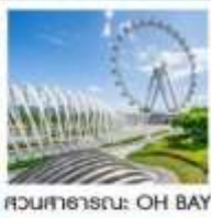
สวนสาธารณะ: OH BAY