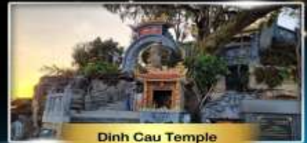
Dinh Cau Temple