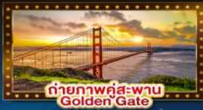
ถ่ายภาพคู่สะพาน Golden Gate