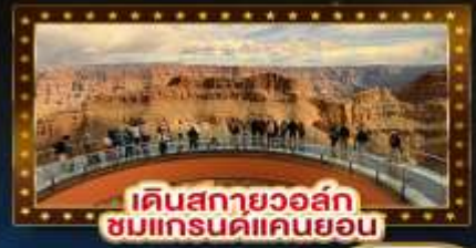
เดินสกายวอล์ก ชมแกรนด์แคนยอน