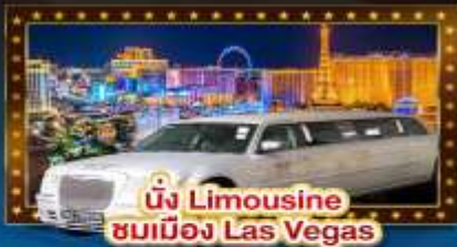
นั่ง Limousine ชมเมือง Las Vegas