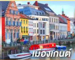
เมืองกันต์