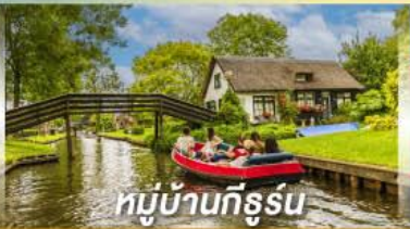
หมู่บ้านทีรูร์น