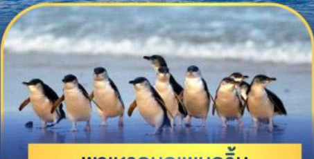
พาเหรดนกเพนกวิน