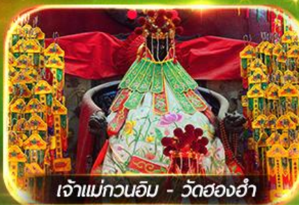
เจ้าแม่กวนอิม - วัดย่องฮำ