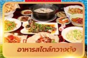
อาหารสไตล์กวางตุ้ง