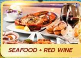
SEAFOOD + RED WINE