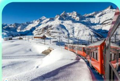
นั่งรถไฟสู่ยอดเขากรอนเนอร์เกรต