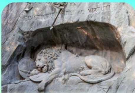
สิงโตหินแกะสลัก