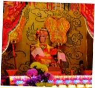
เจ้าแม่ทับทิม จอสเฮ้าส์เบย์