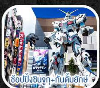
ช้อปปิ้งชินจูกุ+กันดั้มยักษ์