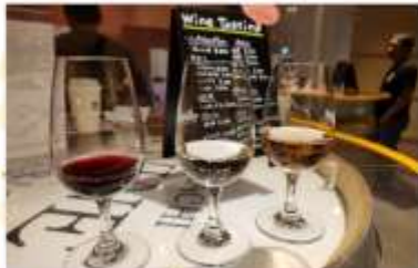
IKEDA WINE CASTLE