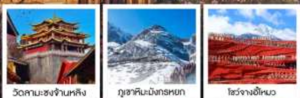
วัดสามะซงจันหลิง