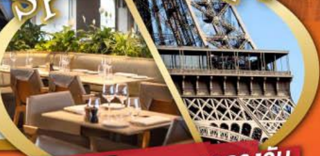
รับประทานอาหารกลางวันบนหอคอไอเฟล