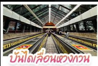
บันไดเลื่อนแขวงกวน