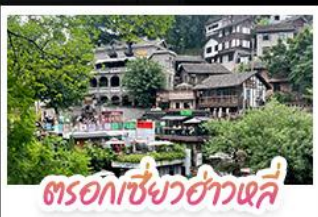
ตรอกเซียวฮ่าวเฉี