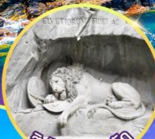
สิงโตหินทะเลสาบ