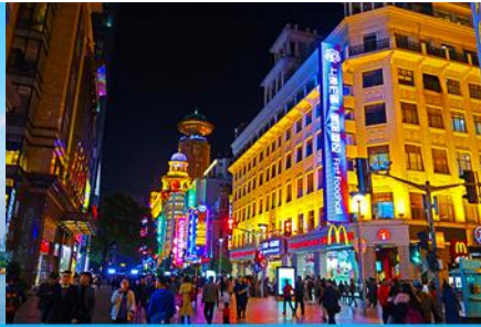
ถนนคนเดินหนานจิงลุ่