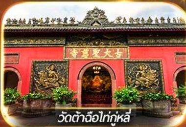
วัดต้าจื่อไท่กุหลี่