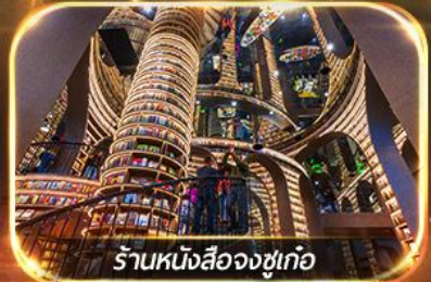
ร้านหนังสือจงซูเก้อ

เที่ยวชมทัศนียภาพ 2 อุทยาน ปี้เฟิงโกว & ชวงเจียวโกว