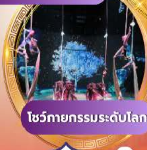
โชว์กายกรรมระดับโลก