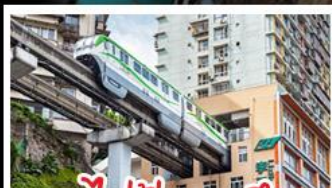
รถไฟไฟทะเลลู่ตีก