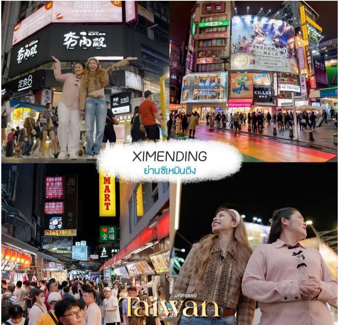
XIMENDING ย่านซีเหมินติง

คำ ๑๐ อีสรอาหารค่ำตามอัยาศัย ณ ตลาดซีเหมินติง ไนท์มาร์เก็ต จากนั้น นำท่านเข้าพักที่ เมืองไทเป 3*หรือเทียบเท่าตามมาตรฐานได้ทุกวัน (โรงแรมที่ระบุในรายการทัวร์เป็นเพียงโรงแรมที่นำเสนอเบื้องต้นเท่านั้น ซึ่งอาจมีการเปลี่ยนแปลงแต่โรงแรมที่เข้าพักจะเป็นโรงแรมระดับเทียบเท่ากัน)