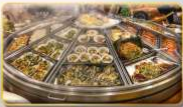
หม้อนึ่งจักรพรรดิ