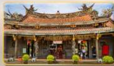
วัดต้าหลงคงเป่าอัน