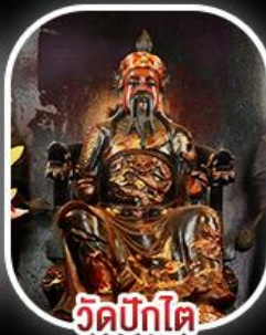
วัดบิกิต