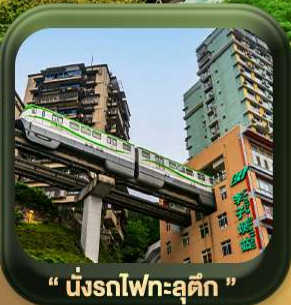
“ นังรถไฟทะลุตึก ”

บินตรงลงวงซิ่ง • อุ้หลง หลุมฟ้าสะพานสวรรค์ • ระเบิดยงแก้ว • อุทยานเขานางฟ้า หงหยาดัง • นังรถไฟทะลุตึก • ศาลาประชาม (ด้านนอก) • หลงหมินฮ่าว มรดกโลกผาหินแกะสลักต้าจู้ • วัดหลิวอัน • ตึกตะเกียบ • ถนนคนเดินเจียฟ้างเป่ย์