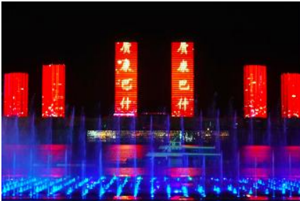
น้ำพุดนตรีคังปาสื่อ