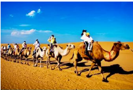
เบ็นทรายเสี่ยวชวาน

เที่ยง รับประทานอาหารกลางวัน ณ ภัตตาคาร (11)