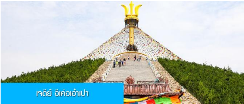
เจดีย์ อี้ค้อเอ้าเป่า

พักที่ DALAEQI SHNAGJING HOTEL โรงแรมระดับ 4 ดาวหรือเทียบเท่าในเมืองต้าลาเท่อ