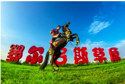
ทุ่งหญ้า เออร์ดอส

พักที่ ORDOS BOYU AIRUI HOTEL โรงแรมระดับ 4 ดาวท้องถิ่น หรือเทียบเท่าในเมืองเออร์ดอส