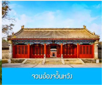
จวนอ๋องจวินหวัง

วันที่หก เมืองเออร์ดอส -อี้ค้อเอ้าเป่า-พิพิธภัณฑ์เครื่องเงิน-จวนอ๋องจวินหวัง- สวนวัฒนธรรมหมงกู่หยวน หลิว-ช้อปปิ้งถนนคนเดิน