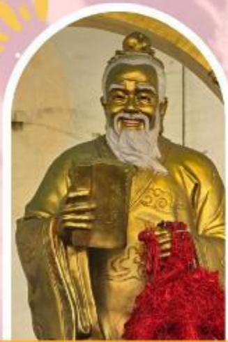
วัดหวังต้าเซียน ขอพรสุขภาพ ความรัก