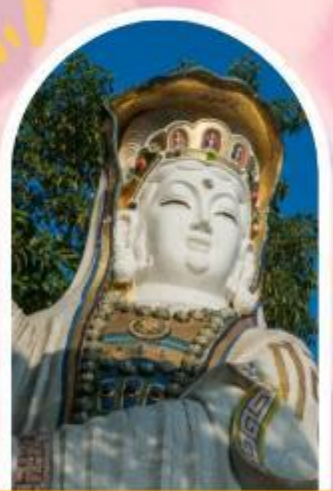
ริพลัสเบย์ รับพลังงานดี เสริมพลังดวงจัญ