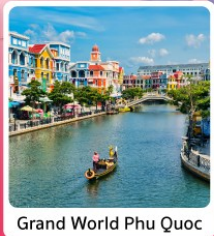
Grand World Phu Quoc