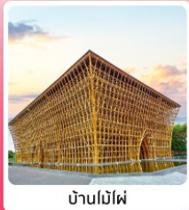
บ้านไม้ไผ่

ไอโอล์ เกี่ยวครบ สวนน้ำ Aquatopia & สวนสนุก Vin Wonder เวนิสแห่งเวียดนาม Grand World Phu Quoc แลนด์มาร์คสุดโรแมนติก