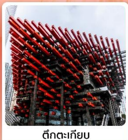
ตึกตะเกียบ