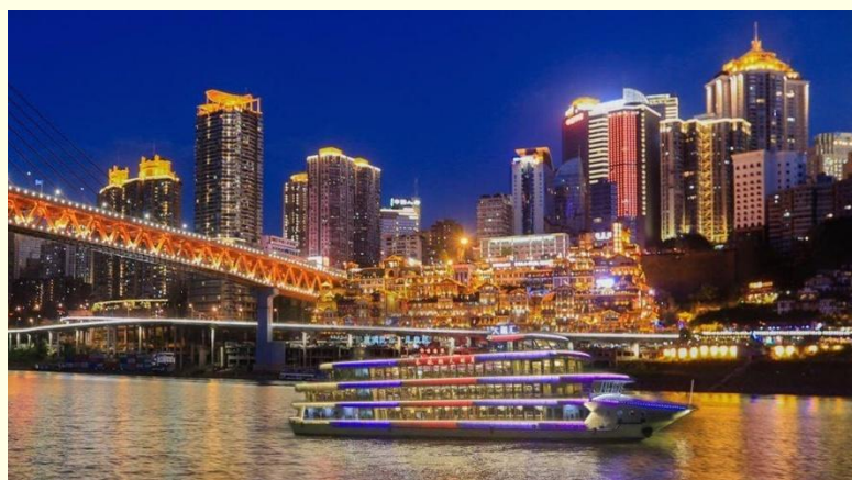
Option เสริม ล่องเรือราตรีชมแม่น้ำสองสาย

*ราคาทัวร์นี้ยังไม่รวมค่าบริการค่าล่องเรือ สำหรับท่านที่สนใจจะมีค่าบริการท่านละ 300 หยวน (ราคาอาจมีการเปลี่ยนแปลง กรุณาตรวจสอบราคาก่อนซื้ออีกครั้ง)*