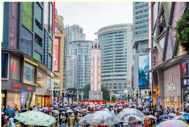
ถนนคนเดินเจี๋ยฟางเป่ย์

และนำท่านไป ถนนคนเดินเจี๋ยฟางเป่ย์ (Jiefangbei Street) ตั้งอยู่บริเวณอนุสาวรีย์ปลดแอก ซึ่งสร้างขึ้นเพื่อรำลึกถึงชัยชนะในการทำสงครามกับญี่ปุ่น แต่ปัจจุบันกลายเป็นศูนย์กลางทางการค้าขนาดใหญ่ ใจกลางเมือง เต็มไปด้วยร้านค้ามากกว่า 3,000 ร้าน ซึ่งมีทั้งอาหาร ซ้อปิ้ง มอลล์ขนาดใหญ่ ให้ท่านได้เดินชมและซ้อปิ้งกันอย่างจุใจ.