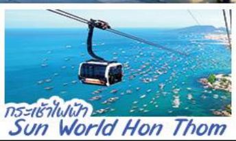
กระเช้าไฟฟ้า Sun World Hon Thom