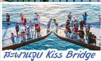
สะพานจูบ Kiss Bridge