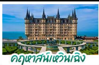
คฤหาสน์เหวินเฉิง

เมืองเก่าชิงเต่า - คฤหาสน์เหวินเฉิง เบียร์ชิงเต่า + อาหารทะเล สตรีทอาร์ต สตูดิโอจิบลิ