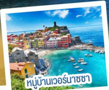
หมู่บ้านเวอร์นาชชา