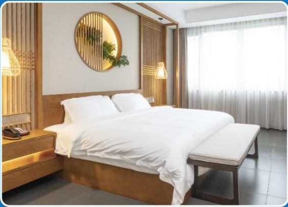
👤👤 DOUBLE (DBL)