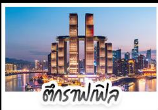
ตึกรูปไฟฟ้