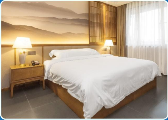
👤 SINGLE (SGL)