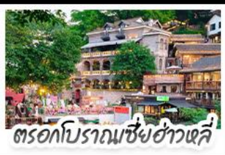
ตรอกโบราณเขี่ยฮ่าวหลี่