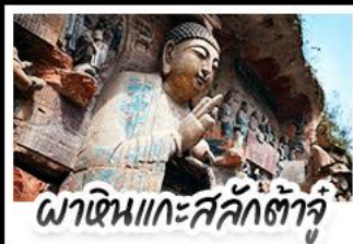
พาทินแกะสลักต้าจู่

10 - 14 มิ.ย. 69 20,888 13 - 17 มิ.ย. 69 20,888 17 - 21 มิ.ย. 69 20,888 20 - 24 มิ.ย. 69 20,888 22 - 26 มิ.ย. 69 20,888 24 - 28 มิ.ย. 69 20,888 26 มิ.ย. - 01 ก.ค. 69 20,888