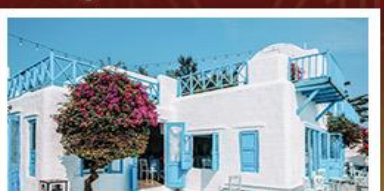
SON TRA MARINA CAFE