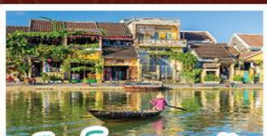
เมืองโบราณเฮงฮัน

! พักบนเขานาฮิลล์ 1 คืน ! สัมผัสอากาศเย็นตลอดปี สตรีตฟรังเศสสุดคลาสสิก - นั่งกระเช้ายาวที่สุด สูบานาฮิลล์ สนุกสุดมันส์ไปกับสวนสนุก The Fantasy Park นมัสการเจ้าแม่กวนอิมองค์ใหญ่ที่สุดของเมืองดานัง - เช็กอินเมืองมรดกโลกฮอยอัน - สนุกสนานไปกับกิจกรรม!!นั่งเรือกระดิง หมู่บ้านกัมทาน เช็กอินร้านกาแฟ SON TRA MARINA CAFE - ไม่หลงร้านช้อปปิ้ง - อิ่มอร่อยกับบุฟเฟ่ต์นานาชาติ , หม้อไฟซีฟู้ด