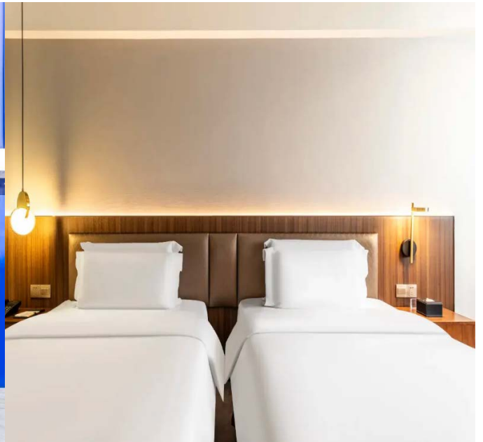
โรงแรมใจกลางย่านช้อปปิ้งชุนซีลู่