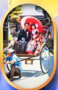
ศาลเจ้าจิ้งจอก