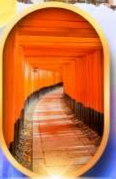
เมืองเก่าทาคายาม่า