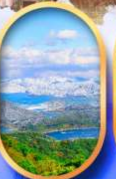
ทะเลสาบมิกะตะ