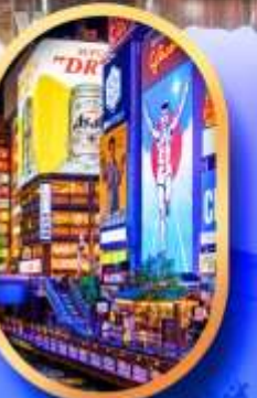
ย่านชิบะโฮนาชิ