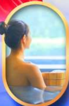
พักโรงแรมออนเซ็น