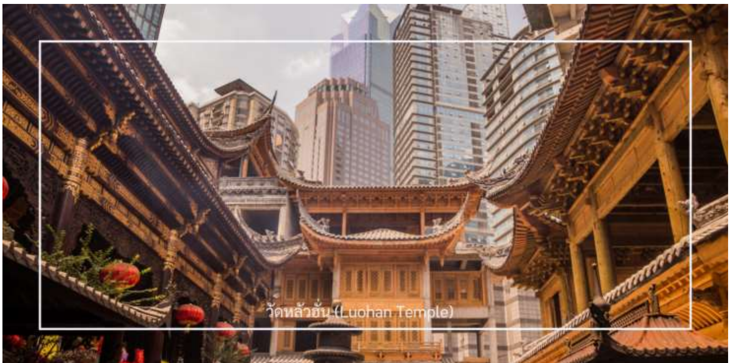
วัดหลัวฮั่น (Luohan Temple)

นำท่านเที่ยวชม วัดหลัวฮั่น (Luohan Temple) หรือที่เรียกว่า "วัดอรหันต์" เป็นวัดที่มีชื่อเสียงในเมืองฉงชิ่ง มีประวัติศาสตร์ยาวนานและมีความสำคัญในด้านศาสนาพุทธ วัดหลัวฮั่นมีพระพุทธรูปและรูปปั้นอรหันต์จำนวนมาก ซึ่งเป็นที่เคารพนับถือของผู้มาเยือน นอกจากนี้ยังมีบริเวณที่ให้ผู้เข้าชมสามารถทำบุญและสวดมนต์