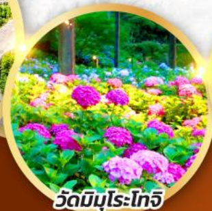
วัดมิมุโระโทจิ