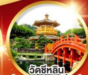
วัดซีหลิน (สวนหนานเท่ลิ้น)