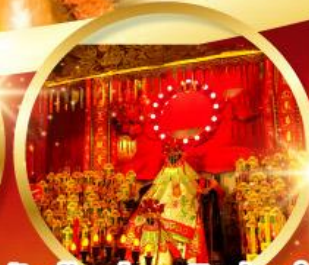
วัดเจ้าแม่กวนอิมฮ้องอำ