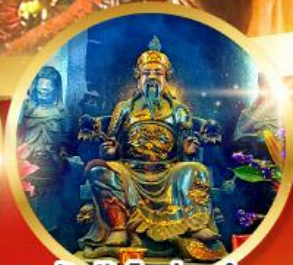
วัดปักไต้ฮ้องอำ