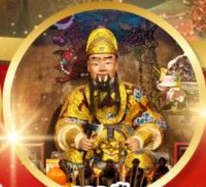
วัดแซก 600 ปีหยุดหลง